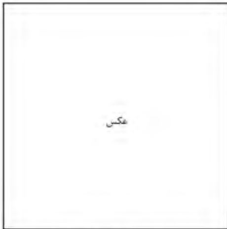
تصویر ۱- توضیح عکس (مأخذ: نام خانوادگی نویسنده، سال انتشار، صفحه)

در مواردی که منبع تصویر، سازمان، نهاد یا اداره دولتی یا غیر دولتی است، در عبارت (نام خانوادگی نویسنده، سال انتشار، صفحه) نام آن سازمان به جای نام خانوادگی نویسنده قرار می گیرد.