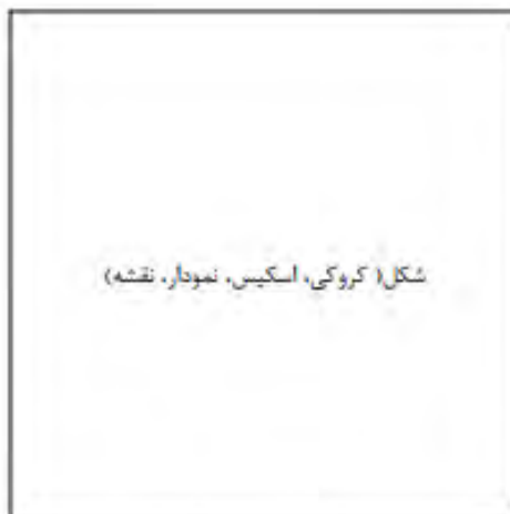
شکل ۱- توضیح شکل