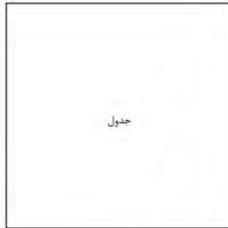
جدول ۱- توضیح جدول (مأخذ: نام خانوادگی نویسنده، سال انتشار، صفحه)